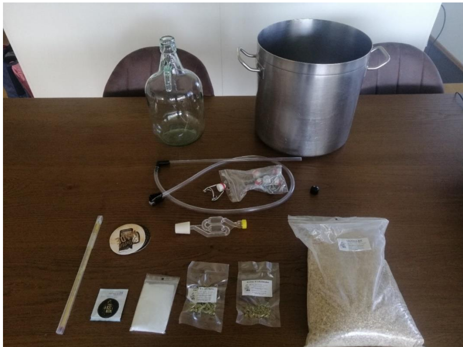
Abbildung 2: Inhalt unseres Bierbrausets

Zuerst machten wir eine Auslegeordnung mit all den Dingen, welche wir gebrauchen werden. Danach begannen wir mit dem ersten Schritt.