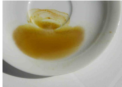
Abbildung 8: Eine gute Jodprobe

Nachdem das Malz 60 Minuten erhitzt wurde, haben wir eine Jodprobe vorgenommen. Ziel der Jodprobe ist es zu prüfen, ob sich die gelöste Stärke vollständig in löslichen Zucker gewandelt hat. Dazu wird eine kleine Menge (1-2 Esslöffel) des Brausudes genommen und in ein weisses Gefäss gegeben. Anschliessend werden 1-2 Tropfen einer Jodlösung hineingegeben. Hat sich der Zucker nun vollständig gewandelt, behält die Jodlösung ihre eigene bräunliche Farbe und es kann zum nächsten Schritt übergegangen werden. Sollte sich die Jodlösung jedoch blau/schwarz verfärben, ist dies ein Zeichen, dass noch Reststärke vorhanden ist.