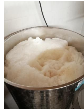
Abbildung 1: Hefe eines obergärigen Bieres