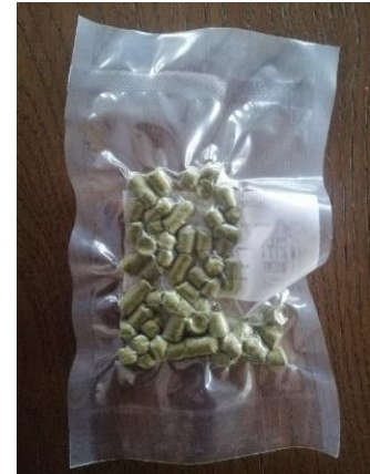
Abbildung 5: Gepresster Hopfen

Beim Hopfenkochen, auch als Einhopfen bekannt, wird die Würze wieder erhitzt und man kocht den Hopfen mit. Das Kochen reicht beim Hopfen schon, um die gewünschten Alphasäuren und ätherischen Hopfenöle zu lösen. Ein weiterer wichtiger Aspekt beim Hopfenkochen ist, dass alle Mikroorganismen in diesem Schritt abgetötet werden, welche später die Fermentation durch die Hefepilze negativ beeinflussen könnten. Bei praktisch allen Bieren gibt man mehrere Male Hopfen hinzu. Dies geschieht in sehr pragmatisch berechneten Abständen und Mengen. Wie viele Male man welchen Hopfen in welchen Mengen dazu gibt, hängt ganz davon ab, was für ein Bier der Brauer machen will. Je früher man den Bitterhopfen dazu gibt, desto bitterer wird das Bier logischerweise. Deshalb macht man das meistens erst in den letzten paar Minuten des Einhopfens. Wir fingen aus diesem Grund