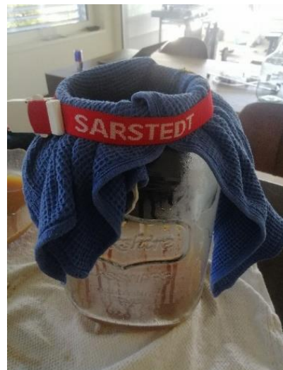
Abbildung 4: Filtrieren der Maische