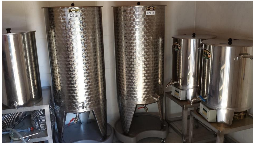
Abbildung 7: In der Mitte des Bildes sind zwei 220 Liter Gärtanks zu sehen, rechts im Bild die beiden Braumeister

Als erstes haben wir seine beiden Braumeister vorbereitet. Dabei handelt es sich um zwei Kochtöpfe, die das Erhitzen des Brausudes übernehmen. Es lässt sich die genaue Temperatur einstellen, welche beim Einmischen benötigt wird. Dadurch muss die Temperatur nicht mehr ständig kontrolliert werden, was viel Mühe spart. Ausserdem ist der Braumeister mit einem Timer ausgestattet, welcher läutet, wenn die Zeit um ist. Die beiden integrierten Pumpen des Braumeisters sorgen für die Zirkulation des Brausudes, damit nicht mehr von Hand gerührt werden muss. Wir haben die Braumeister bereitgestellt und mit jeweils 53 Liter Wasser befüllt, da während dem Maischen etwa 3 Liter Wasser verdampfen. Nun übernahm auch schon der Braumeister das meiste der Arbeit. Wir hatten die gewünschte Temperatur eingestellt und warteten, bis das Wasser warm genug war.