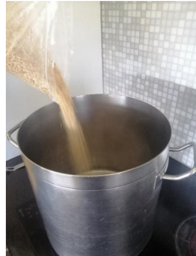
Abbildung 3: Das Malz wird zum Erhitzen in einen Kochtopf geben